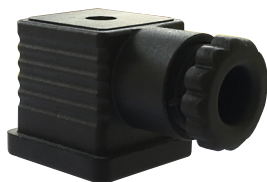
Connettore DIN 40050 DIN 40050 connector