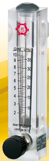
FMP...V / FMP...VR

Ampia gamma di prodotti disponibili. Contattateci per maggiori informazioni.