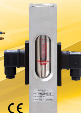
IF...VE - IF...V2E